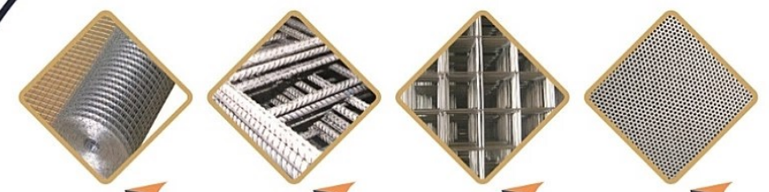
توری جوشی رولی مش آجدار مش ساده ورق پانچ