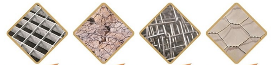
گریتینگ توری گابیون توری حصاری توری فرنگی